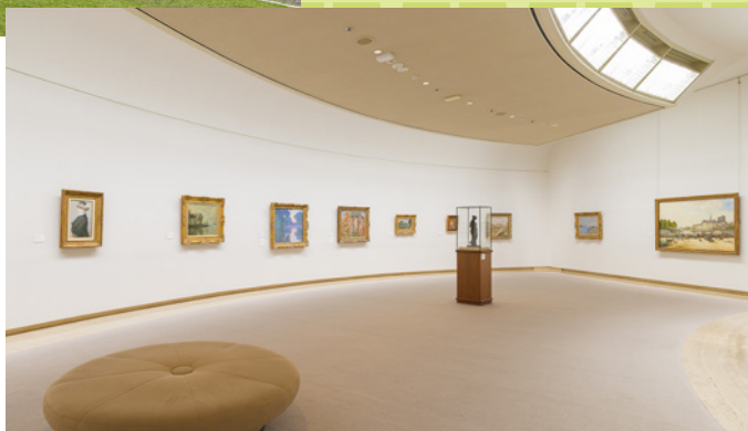
ひろしま美術館 本館展示室

●クルーズフェリーからスーパージェットへの変更は追加料金がかかります。 ●スーパージェットのスーパーシート(2階席)往復ご利用の場合は、事前購入に限り800円プラス。 ●小学生料金設定はございません。 ●車両の設定はございません。 ※写真はイメージです。