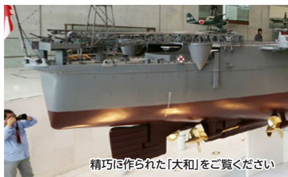
精巧に作られた「大和」をご覧ください